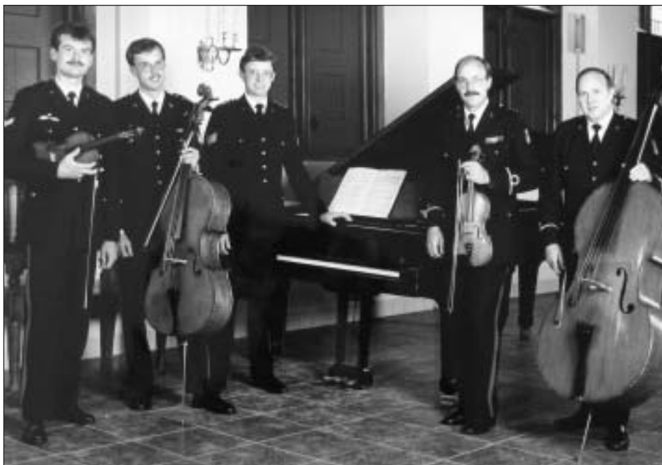
"Het Strijkje" (anno 1987)